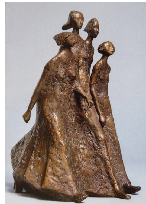
Donne dal passo svelto (Manfred Welzel)

Centro Studi Educativi Kèleuthos – Via dei Reti 18, Parona (VR)