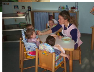
Asilo Nido Cooperativa "L'Infanzia"