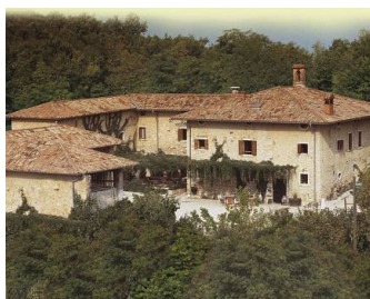
Ca' Verde/8 Marzo di Sant'Ambrogio di Valpolicella